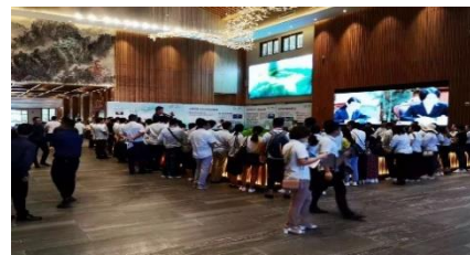
恩平佳源帝都溫泉山莊銷售現場