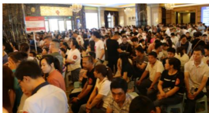
巴黎都市銷售現場