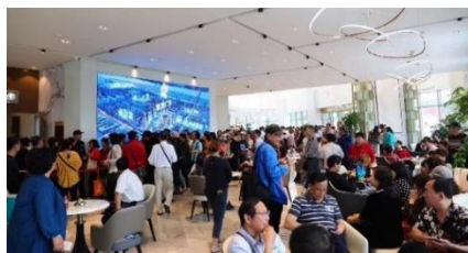
佳源廣場項目銷售現場