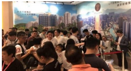
T-PLUS菁雋項目銷售現場