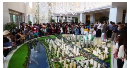
佳源廣場項目銷售現場