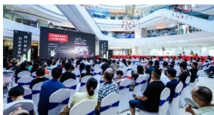
佳源銀座銷售現場