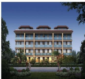
青島 | 海玥府效果图