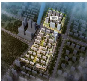
青島 | 佳源·雙子星城效果图