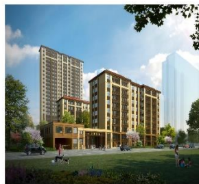
威海 | 佳源名城二期·海業府效果图