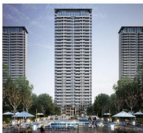
青島 | 佳源華府效果图

1月13日，佳源國際與公司主席沈天晴先生訂立買賣協議，收購其私人持有的多個山東省物業開發項目。這是繼上海市物業資產、物業服務集團及安徽省資產之後，佳源國際再獲大股東注入優質項目。交易初步代價約人民幣61億元，其中現金支付比例僅為15%（約人民幣9億元），其餘部分對價將陸續以發行股份予大股東的方式支付。